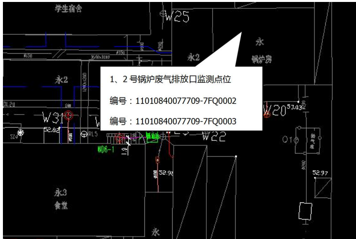
图6：锅炉废气排口监测点为照片